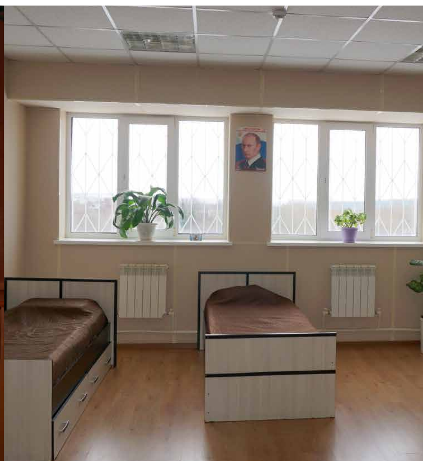
комната на 3-4 человека