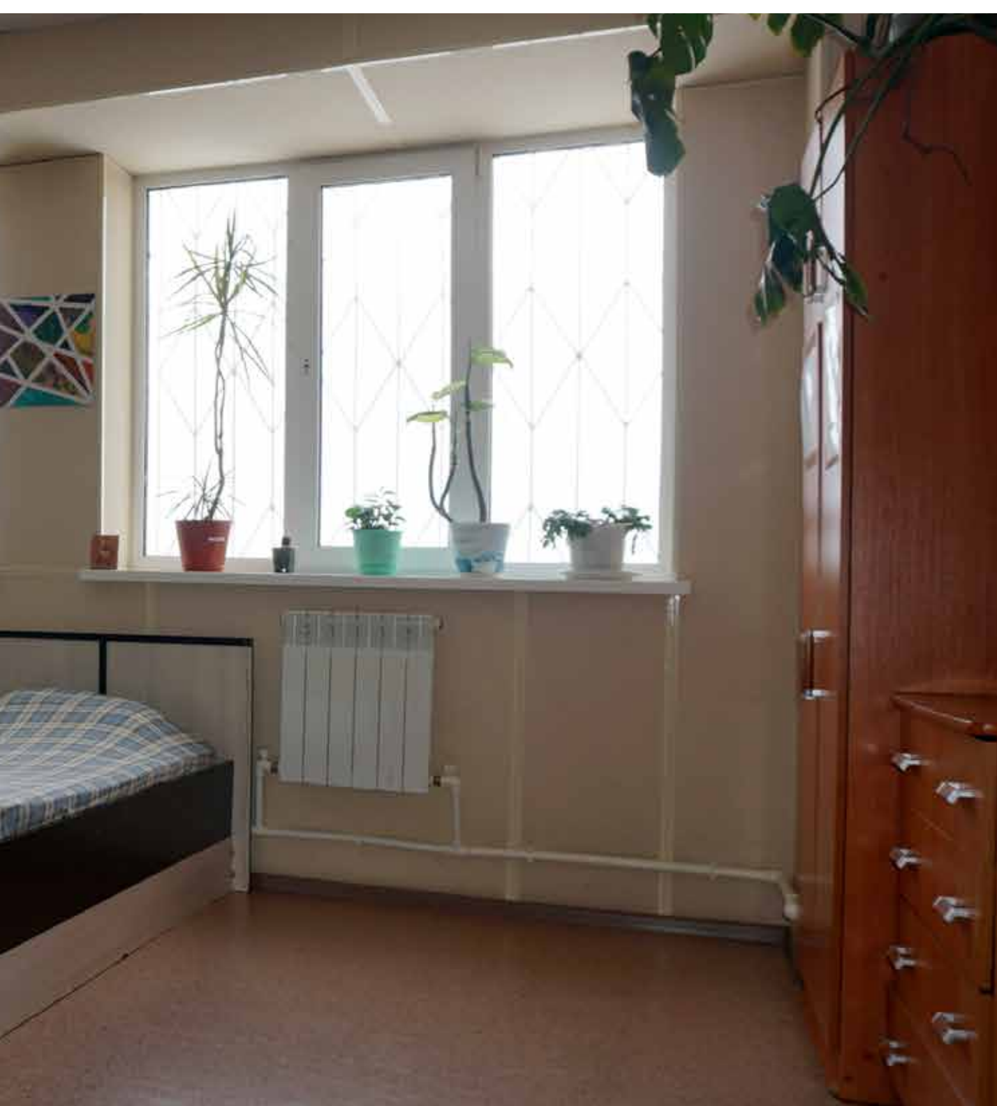
VIP комната на 1-2 человека